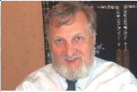
Burgemeester Servranckx: „Ik weet wat het is je in te zetten in een vereniging“.